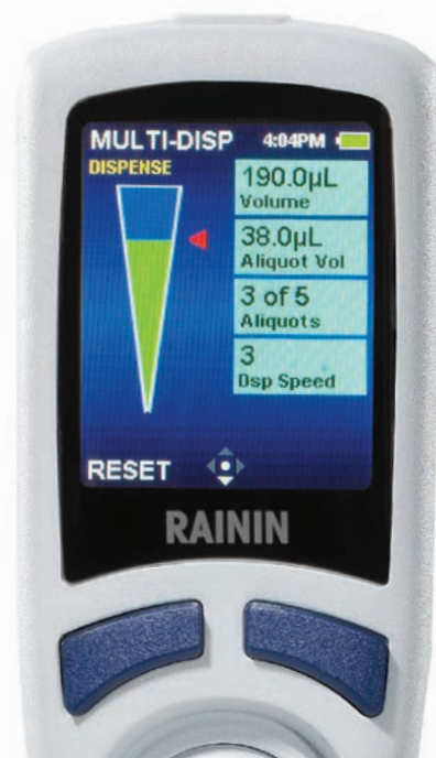
E4 XLS+ en modo multidosificación